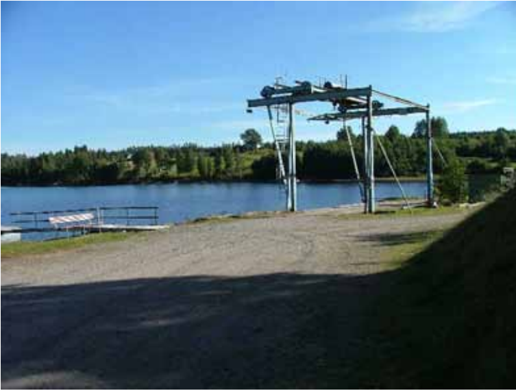
Båtramp vid Nössemark, Stora Le i Dals-Eds kommun. En möjlig källa för spridning av kräftpest mellan olika vattensystem.