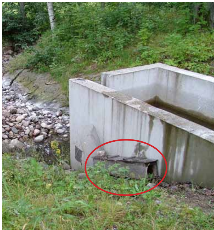
Minkfälla intill damm.

Sannolikt är det dock nästan omöjligt att helt utrota ett kräftbestånd genom ett alltför intensivt fis-