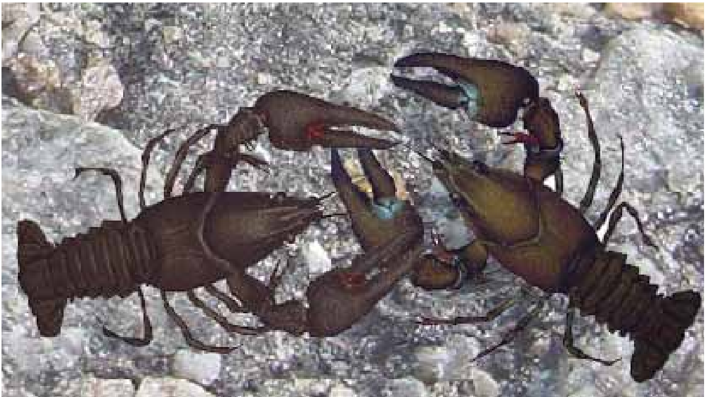
Flodkräfta till vänster och signalkräfta till höger. Lägg märke till de ljusa fläckarna på signalkräftans klor.

fångster med signalkräfter har man fått en uppfattning om hur allvarlig situationen är. I Dalsland har man ca 10 kända lokaler med illegalt utplanterade signalkräfter, varav de två största sorgebarnen är det stora sjösystemet med Stora Le och Lelång. I Värmland finns uppskattningsvis 100 lokaler med illegalt utplanterade signalkräfter, med tyngdpunkten på östra Värmland. För Dalarnas del finns ca 50 rapporterade fall till länsstyrelsen. Mörkertalet är förstås stort, framförallt för Dalarna. Flertalet av de illegala utsättningarna med signalkräfter befinner sig i avrinningsområden som fortfarande hyser flodkräftbestånd och utgör därmed ett mycket stort hot mot dessa.