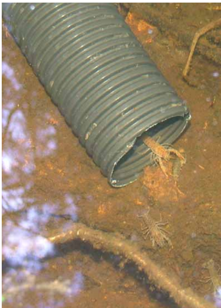
Kräftyngel på väg ut i det fria.

Tidpunkten för utsättningar varierar beroende på vilket utsättningsmaterial man använder sig av. Vid utsättning av försträckta yngel av stadium IV (tre skalbyten) dvs. yngel som är kläckta i odlingsmiljö inomhus med tempererat (17-20°C) vatten bör man vänta med utsättningen av ynglen tills vattentemperaturen uppnått ca 15°C (juni). Dels för att inte