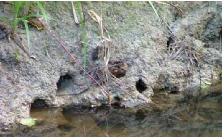
När vattennivån i ett vattendrag sjunker kan man ibland se kräftornas bohålor i lerbankerna.

Utänför sina bohålor är kräftorna känsliga mot predation. Vid födosök, under parningstiden samt vid skalbyten exponeras kräftorna för predatorer. Det är då viktigt att det finns gott om gömsle/skydd i närheten av bohålorna. Beroende på födotillgången kan avståndet från bohålan till där kräftan hittar sin föda variera. Därför är det lämpligt att mellan bohålorna och där födosöket sker, lägga ut ridåer med risknippen och grenar mm. som kräftorna kan gömma sig under.