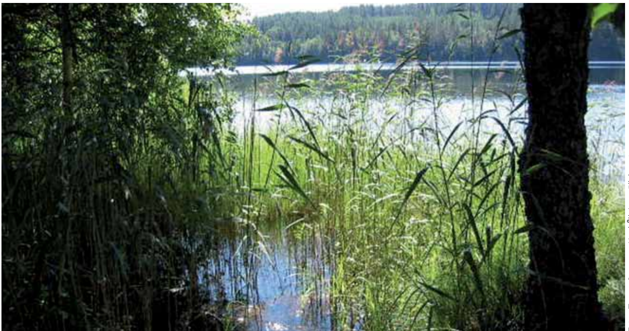
Lidsjön, Gunnarskog i Arvika kommun. Kräftorna slogs ut under 1970-1980-talet pga försurning

Flodkräftan är en av de mest försurningskänsliga organismer som lever i våra sötvatten och kräver därmed ett rent och syrerikt vatten för att kunna existera. Det räcker med en dag med surt vatten, en surstöt efter ett häftigt regn vid fel tidpunkt på året, för att en årskull ska slås ut. Några absoluta gränser vad gäller vattenkemiska parametrar har inte gått att fastställa. Snarare sker successiva förändringar i en kräftpopulation vid ändrande vattenkemiska förhållanden.