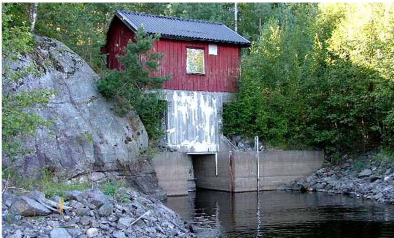
Vandringshinder i tillflöde till Stora Le, Strömviken i Dals-Eds kommun.