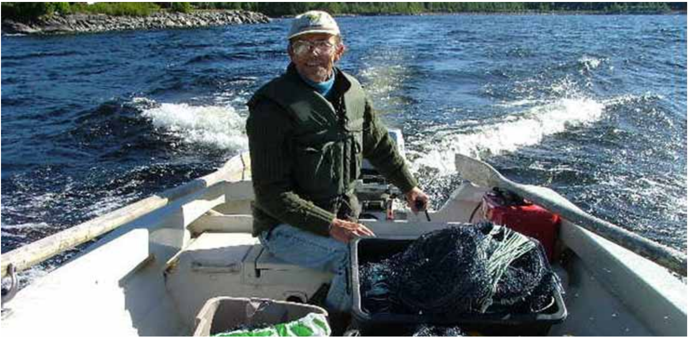
Provfiske i Stora Le, Västra Götalands län