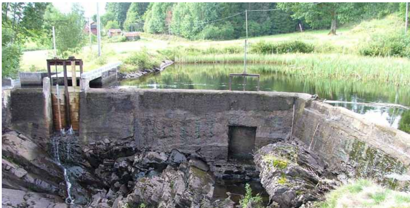
Regleringsdamm vid Teåkersälven.

Vid arbeten i vattendrag, avverkningar, utdikningar mm. medför detta till att mängden finfördelade partiklar ökar avsevärt i vattendraget. Gälblad och rom blir täckta av mineralpartiklar vilket reducerar syrgasutbytet. Dessutom hämmas romsättning, genom att rommen får svårare att fästa på undersidan av