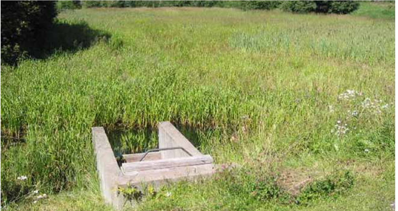
Teakersälven, igenväxt damm.