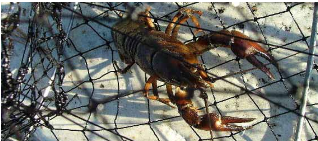
Illegalt utplanterad signalkräfta i Fjällsjön, Eda kommun.

I komplexa vattensystem och motströms i rinnande vatten, går spridningen långsammare. Kräftpstsvampen tycks därför ”leva kvar”. I själva verket pågår också här samma förlopp dvs. svampen infekterar och dödar kräftor, men mycket långsammare än i täta och samlade flodkräftbestånd.