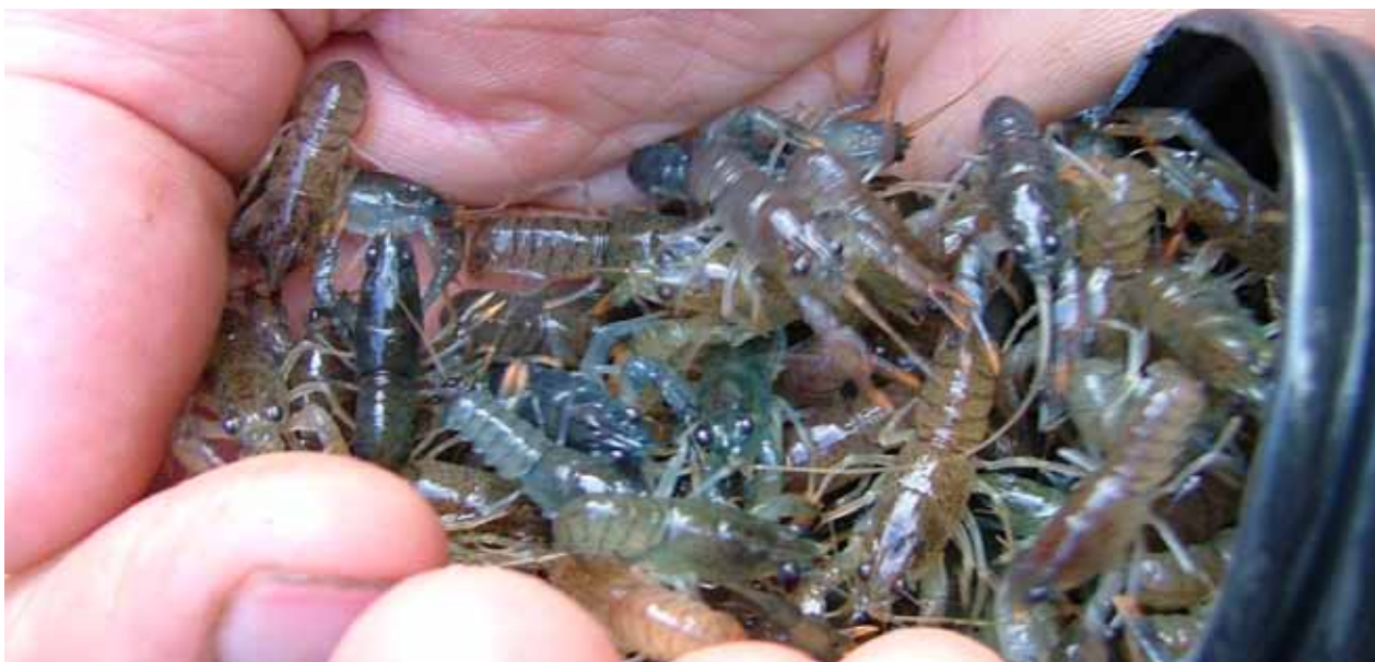
Utplantering av 15-20 mm stora flodkräftfyngel.