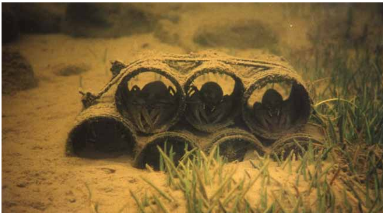
Konstgjorda gömslen som tagits i bruk av kräftor. I första hand bör naturliga material som smälter in i miljön användas.

blering av mink om ett kräftbestånd börjar byggas upp. Det gäller att från första början och framgent bekämpa minken med alla tillbuds stående medel. Med vetskap om att en mink under en natt vid ett naturligt kräftvatten dödade ca 300 kräftor, förstår man lätt vidden av detta rovdjurs betydelse. Väl-gjorda fallor, rätt skötta och riktigt placerade, tillsammans med god jakt- och viltkunskap är de bästa motmedlen mot mink.