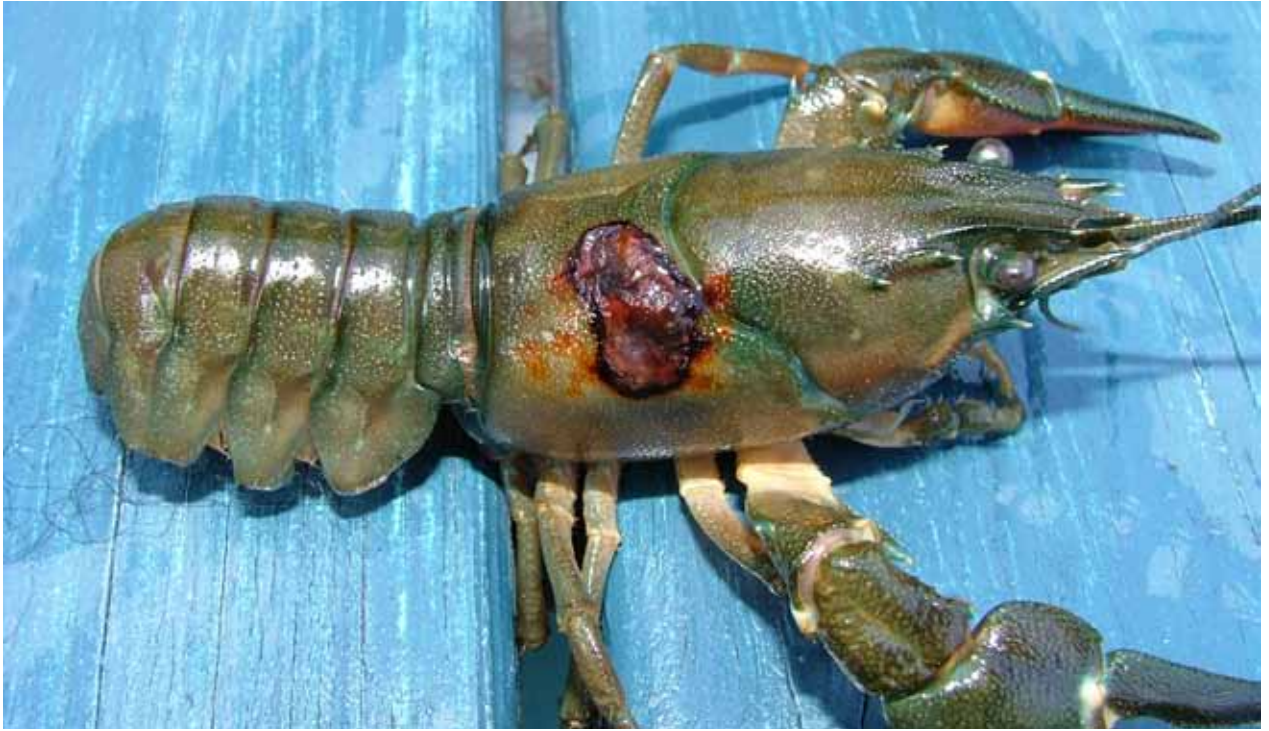
Angrepp av kräftpest.