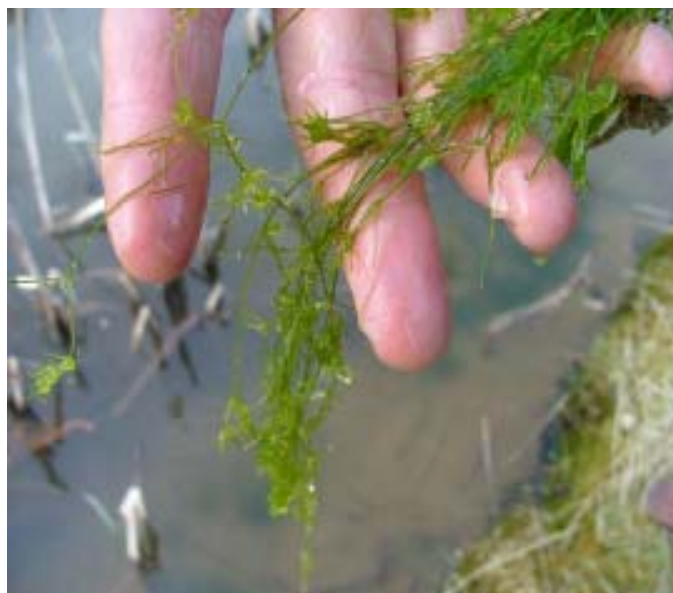
Kransalgen Nitella sp.

1. I september – oktober när vattentemperatur är ca 12-14°C i viltvattnet där avelskraftorna hämtas från, plockas honor och hanar in till odlingen för parning. Var noga med att undersöka avelskraftorna om de är parningsmogna eller inte. Sänk temperaturen i odlingen till ca 10°C och invänta parningen. Lyft upp honorna efter någon dag för att undersöka om de blivit parade, detta syns tydligt om de har spermipaketet vid könsöppningen och under stjärtflikarna. Har man tur kan man även få se parningen live om man i dunkelt ljus försiktigt tittar på. När honorna är parade plockas hanarna bort. Se till att det finns gömslen i karen under hela perioden. Låt några allöv ligga i karen, var uppmärksam på om de äter upp löven eller inte. Anpassa fodergivorna efter behov. Har man kontinuerligt några allöv i karen så finns foder tillgängligt för kraftorna vid behov.