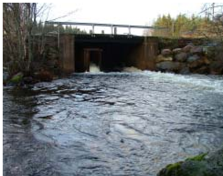
Utloppet, med fisketrappa, ur Stora Bör.