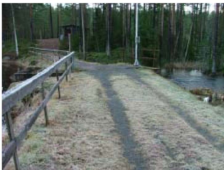
Dammen vid utloppet ur Stor Jangen.