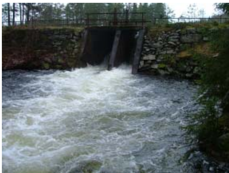
Dammen vid utloppet ur Öjesjön. Bilden är tagen i december 2006. Notera det höga vattenflödet.