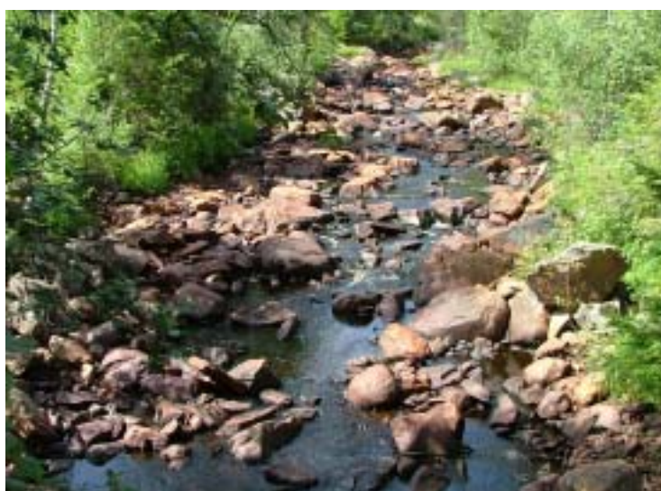
Höksjöälven, vid träbron strax innan mynningen i Svartälven.