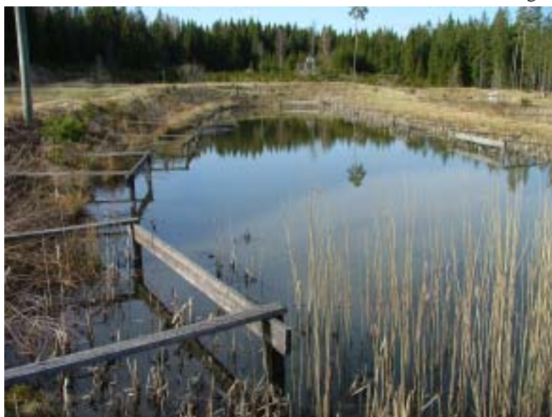
En damm som är ett mellanting mellan oval och rektangulär.

perforera dammvallarna vilket medförde vattenläckage. Om läckaget blir för kraftigt kan detta skära sönder dammvallarna som därmed kan kollapsa. Liksom vattensork kan även kräftorna perforera dammvallarna kraftigt, det har en odlare på Gotland erfarit. Det kan även vara ett tecken på att det finns för lite gömslen i förhållande till tätheterna i dammen.