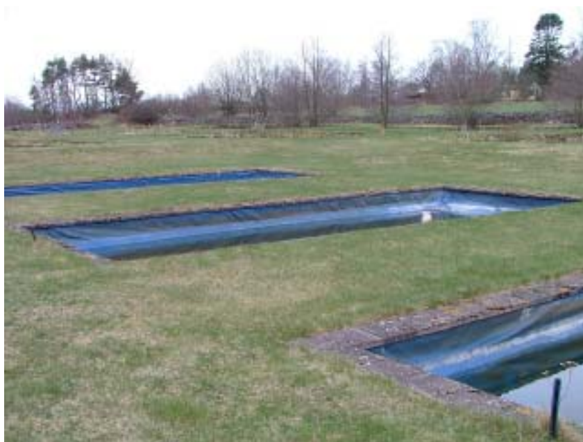
Dammar som är belägna på otäta jordar. För att dammen skall "hålla tätt" har man lagt i en plasduk på botten.