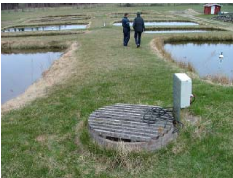
Exempel på ett slutet odlings-system. Fyra dammar är kopplade till ett recirkulerande system. Vattnet pumpas runt i dammarna. Vatten fylls på, via grundvatten, endast vid behov.

* Man måste veta varifrån vattnet har sitt ursprung. Kommer tillflödet från ett system som innehåller kräftor måste man vara mycket uppmärksam. Drabbas systemet av t ex kräftpest kommer detta även att slå ut odlingen.